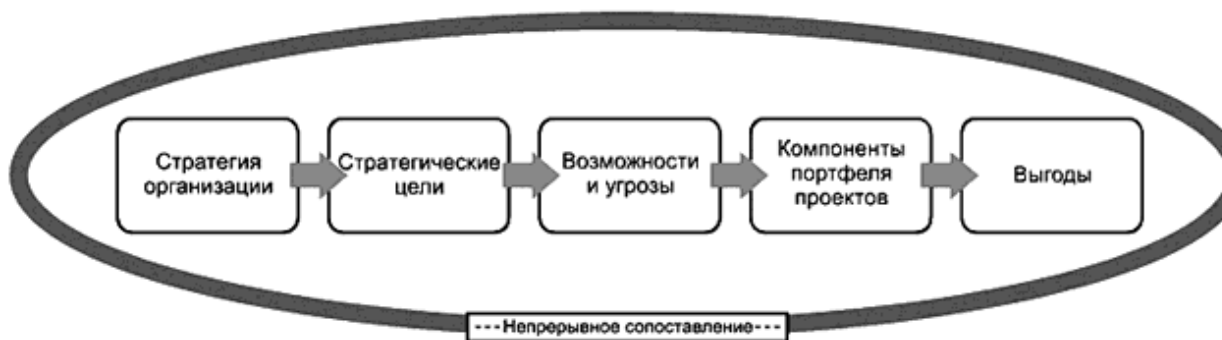
Рисунок 4 - Непрерывное сопоставление стратегии организации с планируемыми выгодами