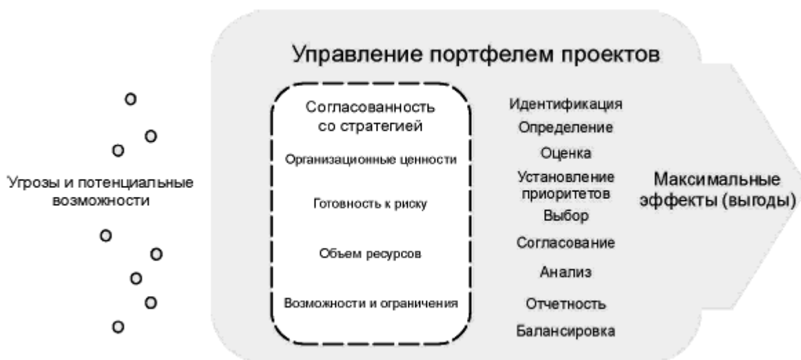
Рисунок 2 - Структура управления портфелем проектов

организации. При подобном подходе оценивают новые потенциальные возможности или угрозы, выбирают, устанавливают приоритеты и утверждают компоненты портфеля. Компоненты портфеля проектов можно изменять, а также ускорять их выполнение, откладывать или прекращать их реализацию.