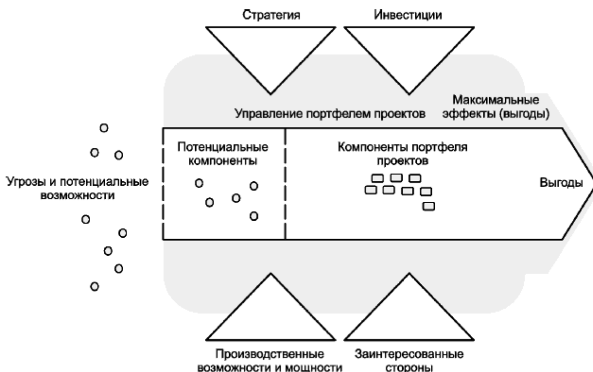
Рисунок 1 - Управление портфелем проектов в контексте организации

Указанные принципы следует применять независимо от существующей организационной среды. Кроме того, для управления портфелем проектов с максимальным эффектом и в соответствии с организационной стратегией необходимо создать предварительные условия, обеспечивающие поддержание управления портфелем проектов.