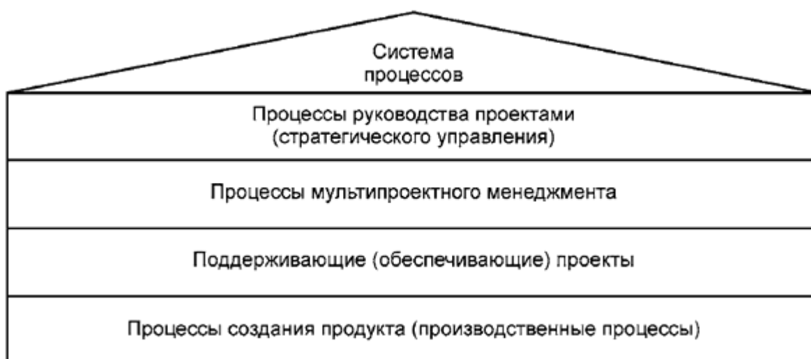
Рисунок 1 - Система процессов

Система процессов, представленная на рисунке 1, содержит основные группы процессов организации и их связи друг с другом. При этом различают четыре группы процессов, а именно, процессы руководства проектами, процессы мультипроектного менеджмента, поддерживающие (обеспечивающие) процессы и процессы создания продукта.