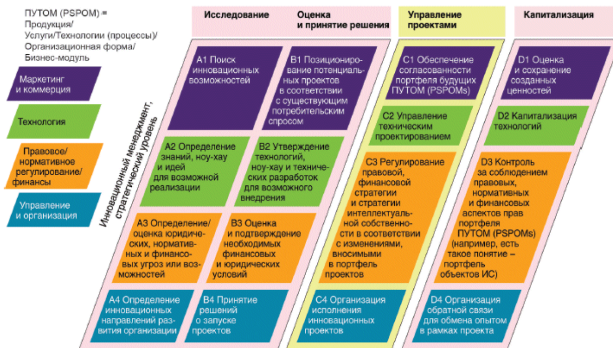
Рисунок 3 - Структурная схема стратегического уровня