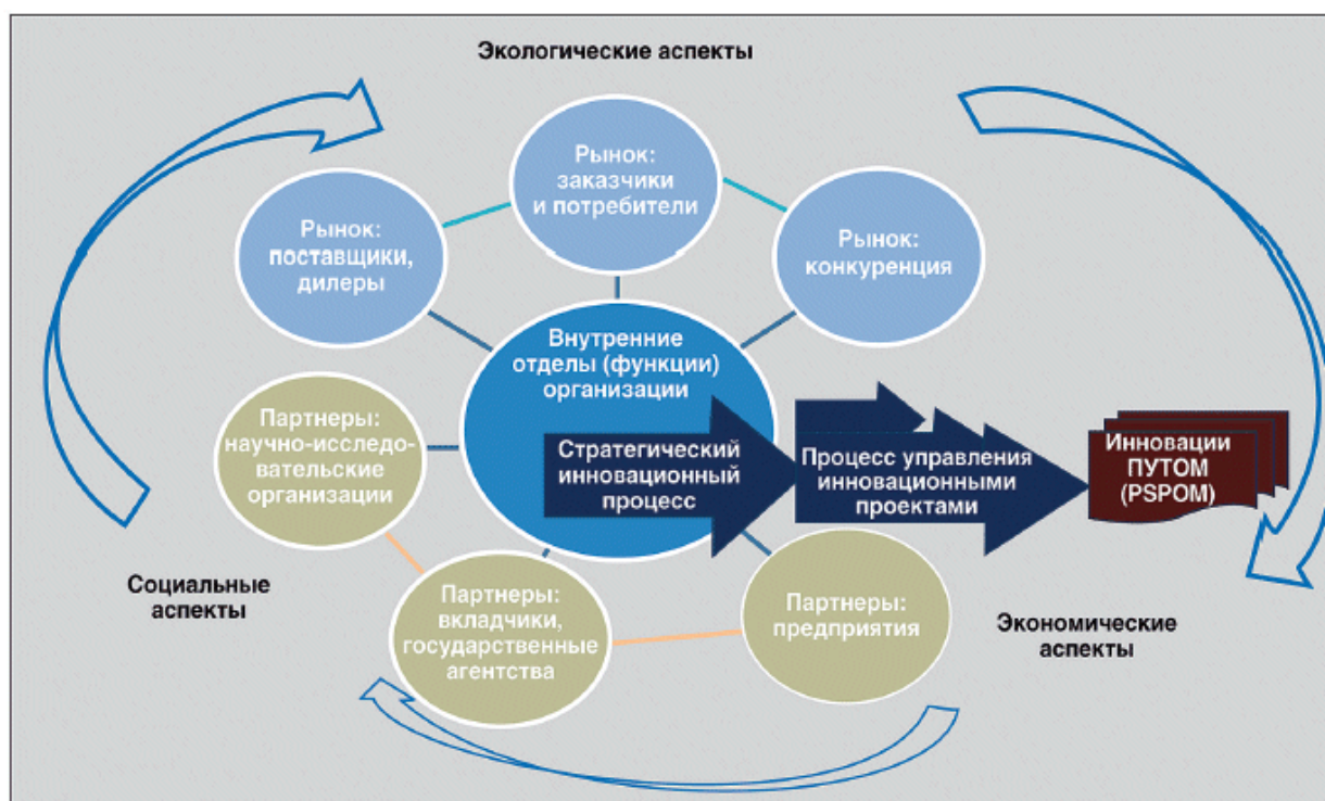
Рисунок А.1 - Графическое представление экосистемы инновационного менеджмента