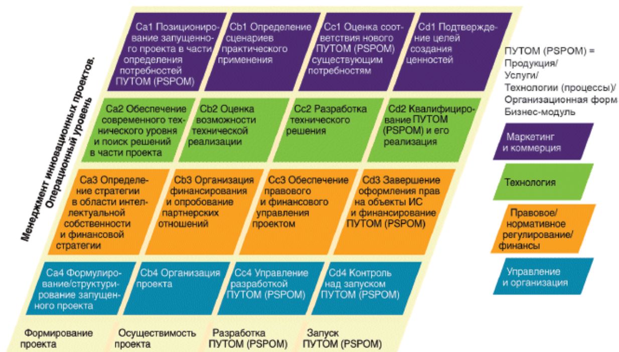
Рисунок 4 - Структурная схема операционного уровня

Примечание - Термин "ПУТОМ (PSPOM)" охватывает все формы инноваций (производственные, в сфере услуг, процессные, организационные и бизнес-модели).