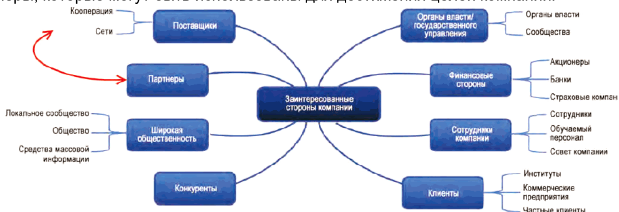
Рисунок Б.1 - Графическое представление групп заинтересованных сторон

В таблице Б.1 приведены примеры групп заинтересованных сторон, которые могут влиять на компанию, возможная проблематика и области действий, а также меры, которые могут быть использованы для достижения целей компании.