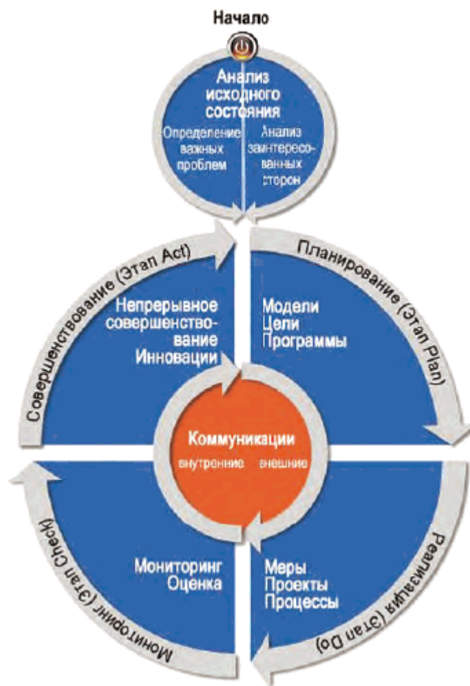
Рисунок 2 - Структура устойчивого менеджмента на основе PDCA-модели