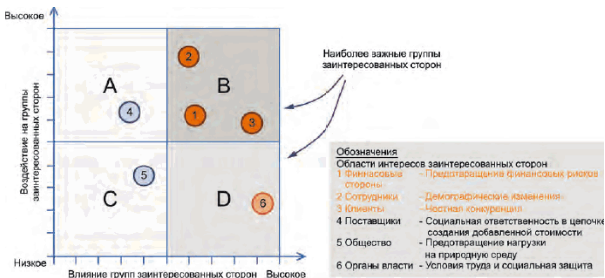
Рисунок Б.2 - Формирование матрицы групп заинтересованных сторон