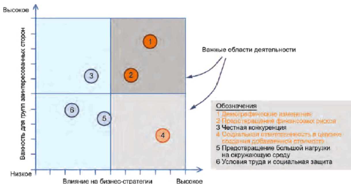
Рисунок В.1 - Формирование матрицы значимости проблем

При анализе значимости проблем принимаются во внимание все наиболее важные вопросы устойчивости компании (которые были выявлены при анализе групп заинтересованных сторон). Проблемы оцениваются по степени важности для групп заинтересованных сторон и актуальности для бизнес-стратегии компании. Проблемы особой степени важности следует рассматривать и решать в первоочередном порядке, а остальные проблемы - далее, по приведенному на рисунке В.1 порядку.