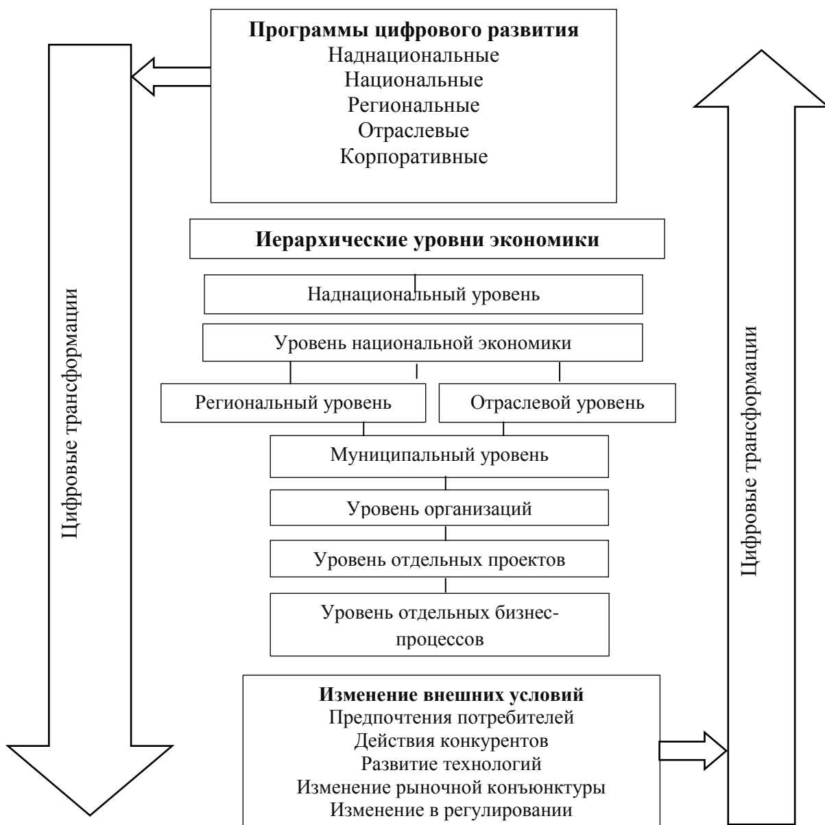
Рисунок 1 – Иерархический подход в рамках цифровых трансформаций

условии одновременного «движения снизу», когда драйверами развития выступают организации и граждане. Исследование показывает, что формирование эффективной цифровой экономики требует налаживания взаимодействия между государством и бизнесом, обществом; бизнесом и обществом. Такого рода взаимодействия в России в последние годы активно развиваются в рамках институтов концессии и государственно-частного партнерства. Поэтому целесообразно использовать полученные в рамках функционирования этих институтов подходы и решения, а также использовать сами эти механизмы для более успешного внедрения достижений цифровой экономики.