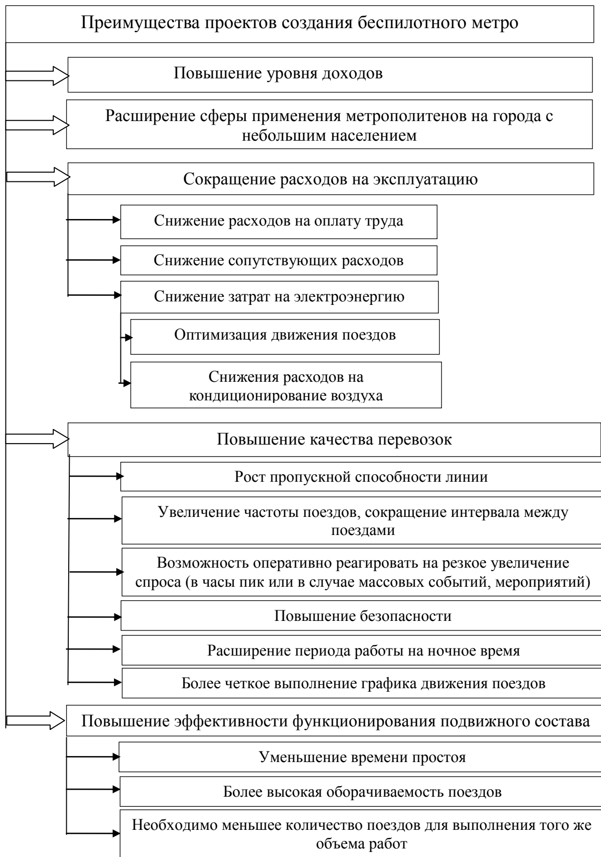
Рисунок 6 – Преимущества проектов строительства беспилотного метро