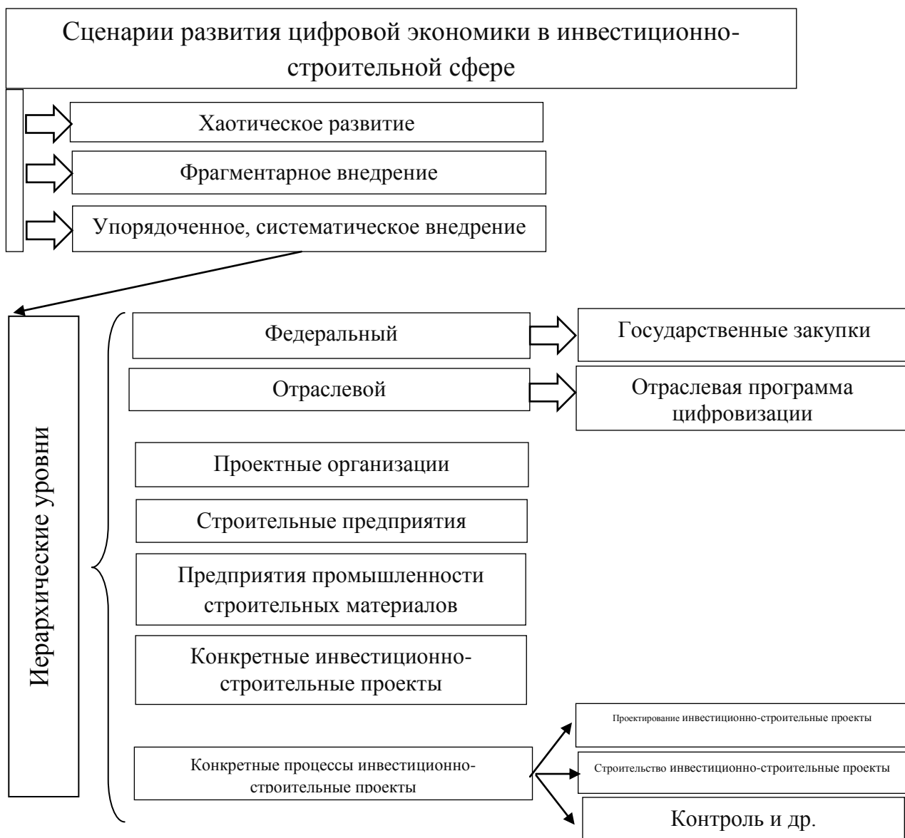
Рисунок 2 – Сценарии развития цифровой экономики в инвестиционно-строительной сфере России

цифровизации строительной отрасли призвана упорядочить протекающие процессы, сформулировав единый вектор отраслевого развития. Вместе с тем нужно определить, насколько адекватны поставленные цели и задачи современным вызовам цифровой экономики и потребностям отрасли.