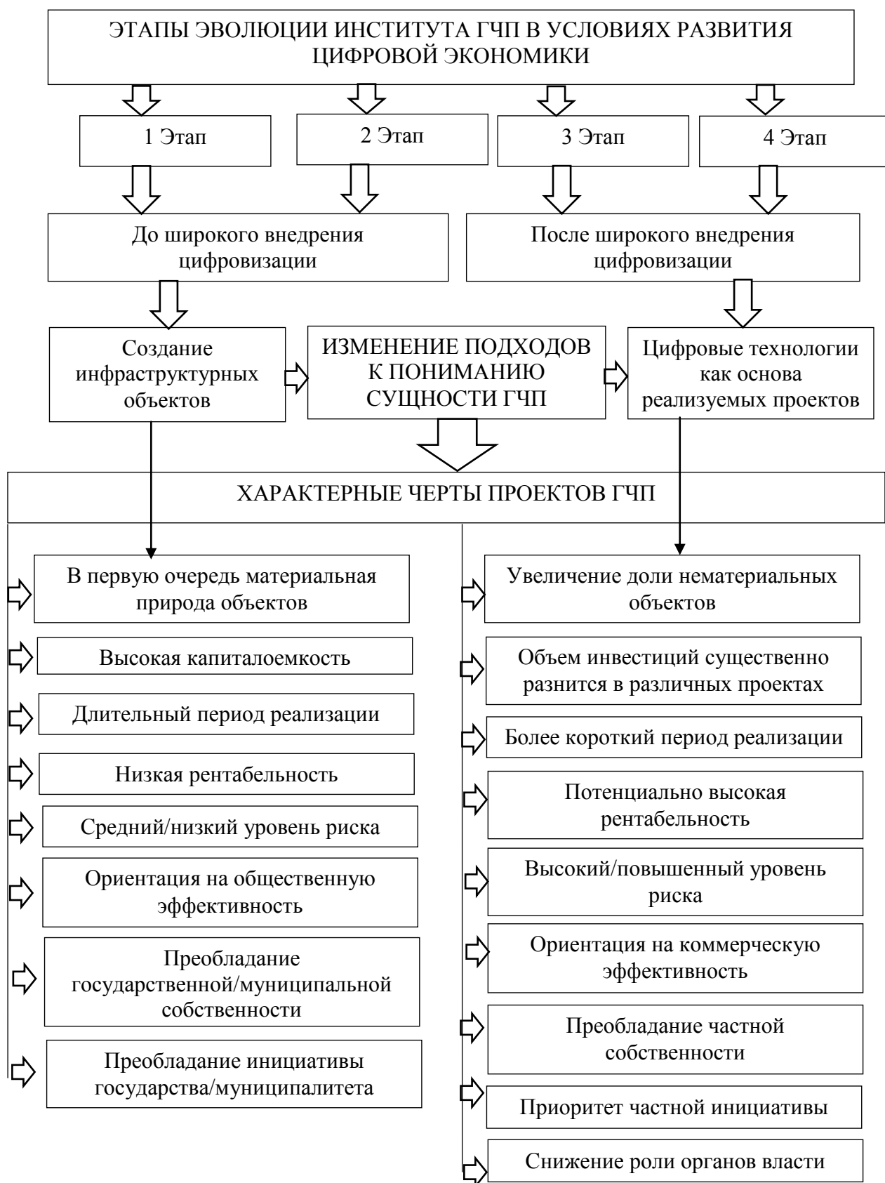
Рисунок 4 – Эволюция института ГЧП в инвестиционно-строительной сфере в условиях развития цифровой экономики