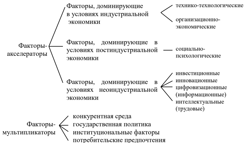
Рисунок 2 - Перечень факторов производительности труда с позиций факторного воздействия и их доминантной роли

мероприятий, направленных на ее повышение. Исходя из этого, предложена авторская систематизация факторов по следующему признаку: «последствия факторного воздействия», с позиций которого факторы разделены на две группы: факторы-акселераторы, непосредственно приводящие к росту производительности труда; факторы-мультипликаторы, приводящие не только к росту производительности труда, но и к ее сокращению (рисунок 2).