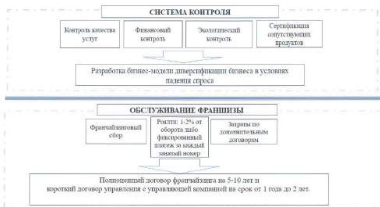
Рисунок 2 – Франчайзинговая модель гостиничной сети в сегменте коллективных загородных средств размещения

На основе франчайзинговой модели разработана сетевая бизнес-модель организации предпринимательской деятельности в сегменте коллективных загородных средств размещения (рисунок 3). Модель представляет собой схематичное описание механизмов деятельности и взаимосвязанных бизнес-процессов франчайзера и предпринимателя. Включает в себя: процессы взаимодействия предпринимателя (средства размещения) с клиентом через систему бронирования франчайзера, с уникальностью отбора по выбору аттракций; процессы формирования гостиничного продукта; процессы взаимодействия с франчайзером. В основе модели лежит отработанная схема основного бизнес-процесса создания гостиничного продукта.