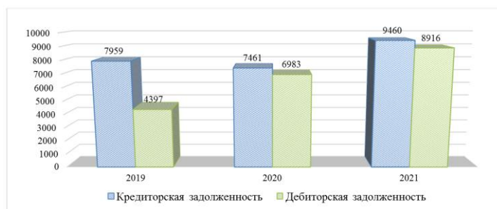
Рисунок 2 – Взаимосвязь кредиторской и дебиторской задолженности организации за 2019-2021 гг.

На рисунке 2 представлена взаимосвязь кредиторской и дебиторской задолженности организации за период 2019-2021 годы.