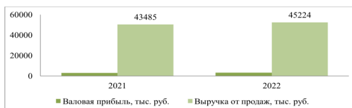
Рисунок 5 – Планируемая динамика изменений от внедрения 1С «Финансовое планирование»

По данным таблицы 10 мы видим, что темп роста составил 104 %, планируемое увеличение выручка от продаж вырастет на 1739,4 тыс. руб. Более подробную динамику изменений рассмотрим на рисунке 5.