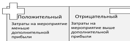
Рисунок 4 – Экономический эффект от внедрения

эффект от внедрения. При положительном результате экономического эффекта, рекомендую обучить за счет организации всех сотрудников бухгалтерии работе с данным блоком 1С «Бухгалтерия». На рисунке 4 рассмотрим, какой экономический эффект бывает.