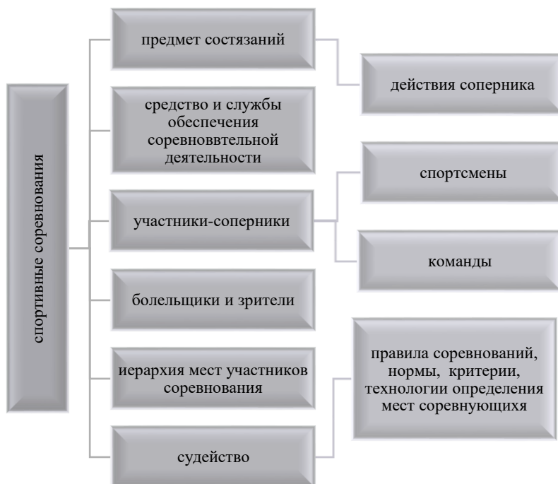
Рисунок 1 – Структура спортивных соревнований

Структура спортивного соревнования с позиции управления представляет собой много векторную модель (рисунок 1).