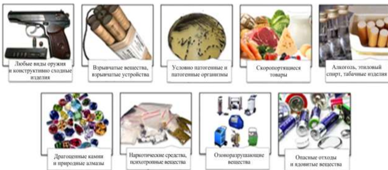
Рис. 2. Товары, запрещенные к провозу посредством МПО

На рис. 2 представлены товары, запрещенные к провозу посредством МПО.