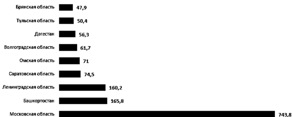
Рис. 2. Регионы с наибольшим число выезжающих работников в 2022 г., тыс. человек

По данным Росстата, Башкирия заняла 10-е место в рейтинге регионов с наибольшей долей жителей, выезжающих на работу в другие субъекты страны (рис. 2). Наиболее часто жителей Башкирии привлекают для работы в Ямало-Ненецком автономном округе (12 %), а также в Москве и Московской области, Челябинской области, Санкт-Петербурге, Якутии, Амурской и Мурманской областях [4].