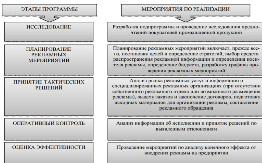
Рисунок 2 – Программа организации управления рекламной деятельностью на предприятии

Представим программу организации управления рекламной деятельностью на предприятии для целей повышения его эффективности, которая представлена на рисунке 2.